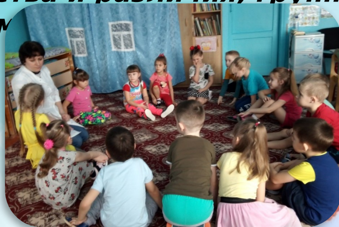
«Кому без них не обойтись?»