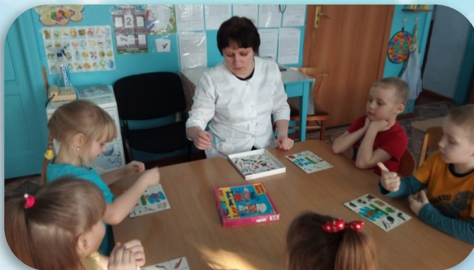
Лото «Кем Быть?»