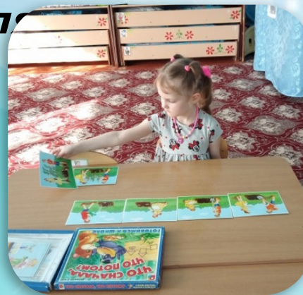
«Что сначала, что потом?»